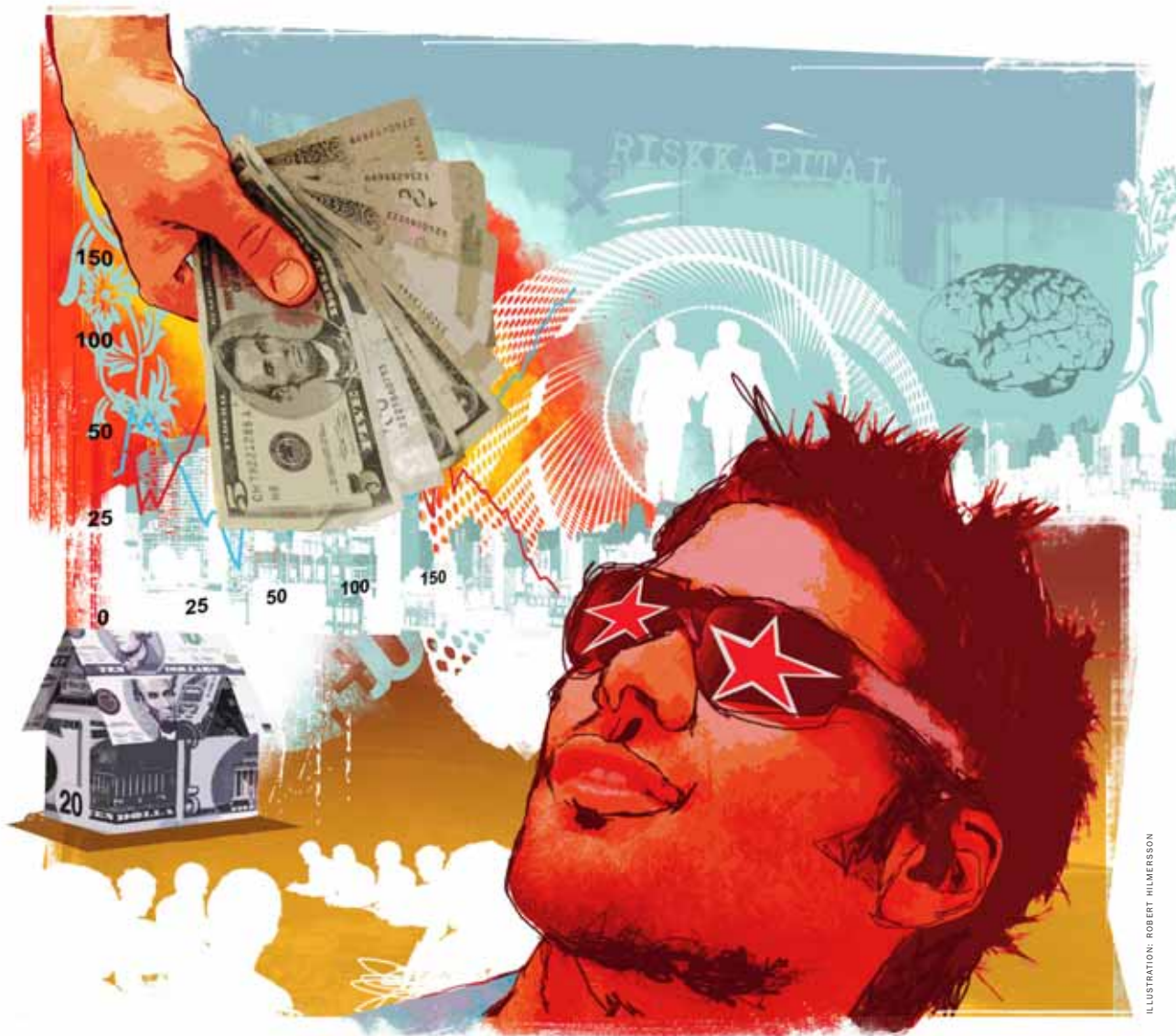
ILLUSTRATION: ROBERT HILMERSSON

RISKKAPITAL RISKKAPITAL INVESTERAS IDAG I STOR OMFATTNING I MÅNGA OLIKA BRANSCHER. EN RISKKAPITALINVESTERING KAN BLI EN LÖNANDE AFFÄR FÖR ALLA INBLANDADE PARTER, OM DU ÄR VÄL FÖRBEREDD.