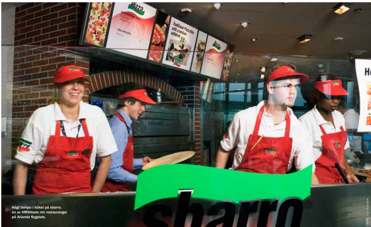
Högt tempo i köket på sbarro, en av HMSHosts nio restauranger på Arlanda flygplats.