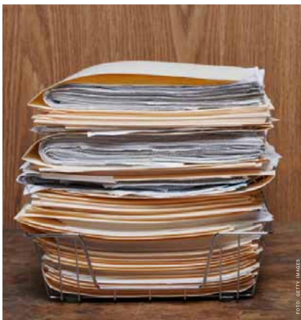
I dag arbetar 90 % av alla svenska företag med traditionell fakturahantering, där papper skickas fram och tillbaka inom organisationen. Genom att gå över till elektronisk fakturahantering sänker företaget den kostnaden med 50–70 %.

Med elektronisk fakturahantering skannas inkommande pappersfakturer in. Programvaran känner av vad som är organisationsnummer, delposter, moms, totalsumma, fakturerings- respektive betalningsdatum. Även om olika företag ställer upp sina fakturor på olika sätt så finns det formalia som gör att program-